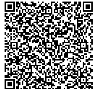
vCard en format QRcode